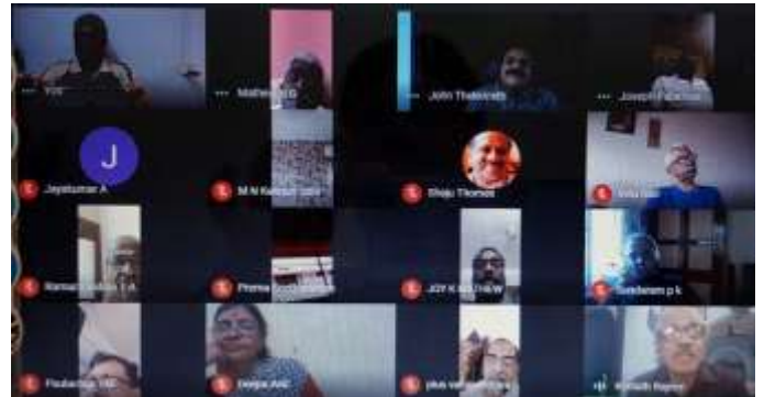
എസ്.ബി.ഐ. പെൻഷനേഴ്സ് അസോസിയേഷന്റെ ആലപ്പുഴ ഏരിയാ കമ്മറ്റി അംഗങ്ങളുടെ യോഗം ഒക്ടോബർ 31ന് ഓൺലൈനിൽ നടന്നപ്പോൾ

ഒരു സൃഷ്ടിയും ഒരിക്കലും പൂർണ്ണമാകുന്നില്ല. സുഷ്മമായി നിരീക്ഷിച്ചാൽ കുറവുകൾ