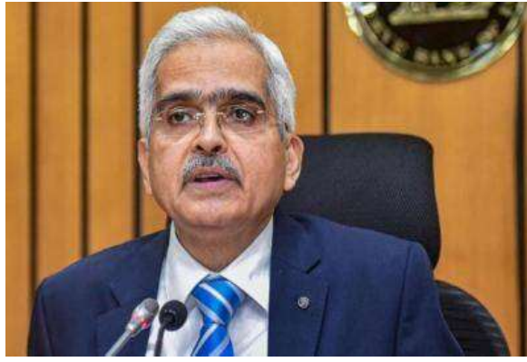
ആർ.ബി.ഐ. ഗവർണർ ശ്രീ. ശക്തികാന്ത ദാസ്

പുറത്തു നിന്നുള്ള മൂന്ന് പുതിയ അംഗങ്ങളെ ഉൾപ്പെടുത്തി മോനിട്ടറി പോളിസി കമ്മിറ്റി (എം.പി.സി) പുതുക്കിയ ശേഷം ഒക്ടോബർ ഒൻപതിന് കൂടിയ ആദ്യ യോഗത്തിൽ ആർ.ബി.ഐ. അടിസ്ഥാന നിരക്കുകൾ മാറ്റമില്ലാതെ തുടരുന്നതിന് തീരുമാനിച്ചു.