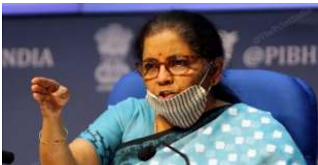
കേന്ദ്ര ധനമന്ത്രി ശ്രീമതി. നിർമല സീതാരാമൻ

രാജ്യം ലോക്ക്ഡൗണിലേയ്ക്ക് കടന്നപ്പോഴും അതിന് ശേഷവും ബാങ്ക് ജീവനക്കാർ ചെയ്തുവരുന്ന കഠിനാധ്വാനത്തെ പ്രകീർത്തിച്ച് കേന്ദ്ര ധനമന്ത്രി ശ്രീമതി നിർമല സീതാരാമൻ. ബാങ്ക് ജീവനക്കാർ വളരെ ദുഷ്കരമായ സാഹചര്യങ്ങളിലും സർക്കാരിന്റെ എല്ലാ പദ്ധതികളും നടപ്പാക്കുന്നതിന് സർവാത്മനാ സഹരിച്ചുവരികയാണ്. ഈ സമർപ്പണത്തെ ഒരു ബിഗ് താക്സ് പറഞ്ഞല്ലാതെ അഭിമുഖീകരിക്കാനാവില്ലെന്ന് അവർ പറഞ്ഞു. പുതിയതായി നിയമിതനായ എസ്.ബി.ഐ. ചെയർമാൻ ശ്രീ. ദിനേഷ് കുമാർ ഖാരയോട് ഇന്ത്യൻ ബാങ്ക്സ് അസോസിയേഷനുമായിച്ചേർന്ന് (ഐ.ബി.എ.) ചർച്ച ചെയ്ത് ജീവനക്കാരുടെയും പെൻഷനുകാരുടെയും കുടുംബ പെൻഷൻകാരുടേയും ദീർഘകാലമായി പരിഹരിക്കപ്പെടാതെ കിടക്കുന്ന പ്രശ്നങ്ങൾ വിലയിരുത്തി പരിഹാരം കാണുന്നതിന് നിർദ്ദേശിച്ചിട്ടുണ്ടെന്നവർ വെളിപ്പെടുത്തി. ബിസ്സിനസ് ലൈനിന് അനുവദിച്ച ഒരു അഭിമുഖത്തിലാണ് അവർ ഇപ്രകാരം പ്രതികരിച്ചത്. പെൻഷൻ സംബന്ധമായി നിലവിലുള്ള എല്ലാ വിവേചനങ്ങളും ദീർഘകാലമായി സഹിച്ചു പോരുന്ന അനീതികളും മന്ത്രിയുടെ ശ്രദ്ധയിൽപ്പെട്ടിട്ടുള്ളതും വാക്കുകളിലെങ്കിലും അനുഭാവം പ്രകടിപ്പിക്കുന്നതും ശുഭോദർക്കുമായിട്ടാണ് പെൻഷൻകാർ കാണുന്നത്. അശ്വാസകരം തന്നെ.