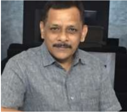
സഹതാപകരമായ ഒരു സാമൂഹികാവസ്ഥയാണ് നാട്ടിലിപ്പോൾ കാണുന്നത്.