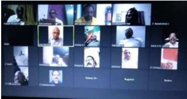
കാസർഗോഡ് ജില്ലാ ഘടകത്തിന്റെ പൊതുയോഗം ഓൺലൈൻ പ്ലാറ്റ്ഫോമിൽ നടത്തിയപ്പോൾ