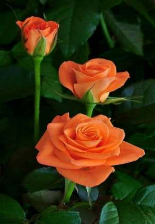
എറണാകുളം ഏരിയാ കമ്മറ്റി അംഗങ്ങളുടെ യോഗം