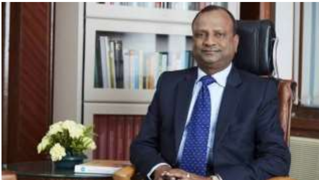
എസ്.ബി.ഐ. ചെയർമാൻ സ്ഥാനത്തു നിന്ന് പടിയിറങ്ങുന്ന ശ്രീ.രജനീഷ് കുമാർ

ചുമതലയേറ്റയുടൻ അസ്സോസിയേറ്റ് ബാങ്കുകളുടെ ലയന പ്രക്രിയ ആദ്യത്തെ വെല്ലുവിളിയായിരുന്നു. എൻ.പി.എ.യ്ക്ക് വേണ്ടി ലാഭം വകമാറ്റി നഷ്ടം പ്രഖ്യാപിക്കേണ്ടി വന്നതും ബാങ്കിന്റെ വിശ്വാസ്യത നിലനിർത്താൻ പെടാപ്പാട് പെട്ടതും മറ്റൊരു വെല്ലുവിളിയായിരുന്നു. ഏറെ വിമർശനങ്ങളും പഴികളും കേട്ട നാളുകൾ. പിന്നീട് വന്ന കൊവിഡ് - 19 മഹാമാരിയും തുടർന്നുണ്ടായ സാമ്പത്തികത്തകർച്ചയും ഉല്പാദന മേഖലയുടെ മാനദ്യവും എല്ലാം ബാങ്കിംഗ് മേഖലയെ ഗുരതരമായി ബാധിച്ചതും കടുത്ത വെല്ലുവിളികളായി. പ്രതിസന്ധികളിൽ സർക്കാരിന് തുണയായും രാജ്യത്തിന് വേണ്ടി സേവനനിരതനായും സമ്പദ് വ്യവസ്ഥയ്ക്ക് താങ്ങായും നിലകൊണ്ട കർമ്മധീരൻ. സ്വകാര്യ മേഖലയിൽ പ്രവർത്തിച്ചു വന്ന യെസ് ബാങ്കിനെ പ്രതിസന്ധിയിൽ നിന്നും കരകയറ്റിയതും ഭരണത്തിൽ ഇടപെട്ട് തകരാറെ നിലനിർത്തിയതും സ്റ്റേറ്റ് ബാങ്കിന് നേടിത്തന്ന യശസ്സും ജനമനസ്സുകളിൽ പകർന്നിട്ട വിശ്വാസ ദൃഢതയും അളവറ്റതാണെന്നതും കൃതജ്ഞതയോടെ സ്മരിക്കട്ടെ. ആരോഗ്യ പൂർണ്ണമായ, സമാധാനവും സന്തോഷവും നിറഞ്ഞ റിട്ടയർമെന്റ് ജീവിതം ആശംസിക്കുന്നു. യാത്രാമംഗളങ്ങൾ!!