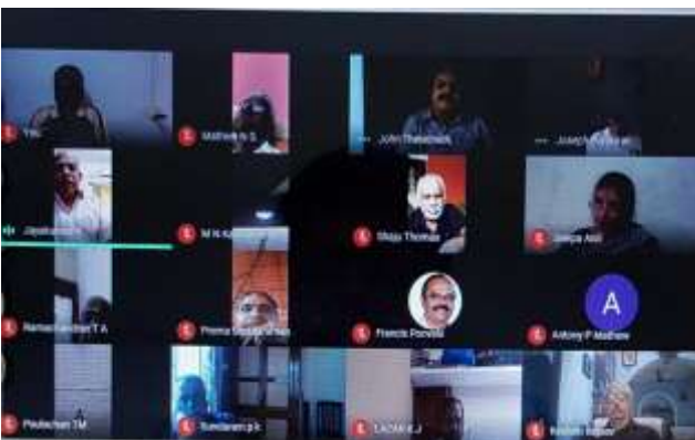
എസ്.ബി.ഐ. പെൻഷനേഴ്സ് അസോസിയേഷന്റെ എറണാകുളം ഏരിയാ കമ്മറ്റി അംഗങ്ങളുടെ യോഗം ഒക്ടോബർ 31ന് ഓൺലൈനിൽ നടന്നപ്പോൾ