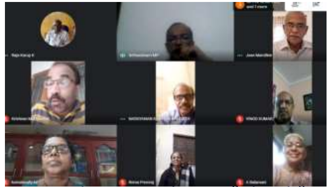
കണ്ണൂർ ജില്ലാ ഘടകത്തിന്റെ എക്സിക്യൂട്ടീവ് കമ്മിറ്റി യുടെ യോഗം ഓൺലൈൻ പ്ലാറ്റ്ഫോമിൽ നടത്തിയപ്പോൾ

സ്റ്റേറ്റ് ബാങ്ക് പെൻഷനേഴ്സ് അസോസിയേഷൻ കണ്ണൂർ ജില്ലാ ഘടകത്തിന്റെ ഭരണസമിതി (എക്സിക്യൂട്ടീവ് കമ്മിറ്റി) ഒക്ടോബർ 17-ാം തിയതി ശനിയാഴ്ച ഓൺലൈനിൽ ഗൂഗിൾ മീറ്റ് പ്ലാറ്റ്ഫോമിൽ യോഗം ചേർന്നു. 11 പേർ പങ്കെടുത്തു.