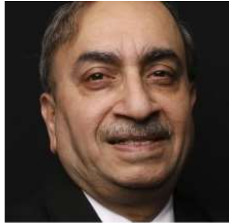
ശ്രീ.ദിനേഷ് കുമാർ വാര

നിലവിൽ മാനേജിംഗ് ഡയറക്ടറായിരുന്ന ശ്രീ.ദിനേഷ് കുമാർ വാരയെ എസ്.ബി.ഐയുടെ ചെയർമാനായി നിയമിച്ചു. 07.10.2020 മുതൽ മൂന്ന് വർഷത്തേയ്ക്കാണ് നിയമനം.