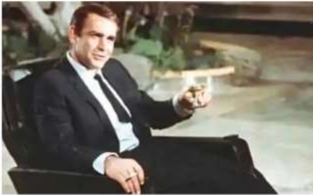
In this file photo dated July 29, 1966, actor Sean Connery shown during filming the James Bond movie 'You Only Live Twice' on location in Tokyo, Japan