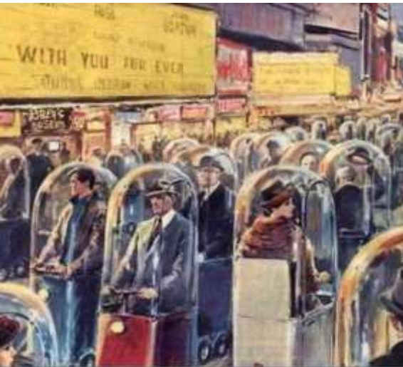
"This painting was done by artist Walter Molino in 1962.... and he titled the painting "Life in 2022"

ഒരു നിരൂപണം (കമന്റ്): അപ്പോഴേ പറഞ്ഞതാ കപ്പലും തണുത്തതും അടുത്തടുത്ത് നടല്ലേ നടല്ലേന്ന്. കേൾക്കേ ! ഇപ്പോ എന്തായി?