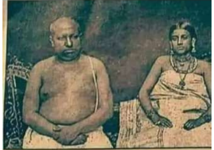
കേരളത്തിലെ ആദ്യ ഫോട്ടോ: (1860) ആയില്യം തിരുനാൾ മഹാരാജാവും രാജപത്നിയും

ഇത് എടുക്കാൻ സായിപ്പ് കൈപറ്റിയ തുക. 2001 പൊൻപണവും 400കിന്റേൽ കുരുമുളകും